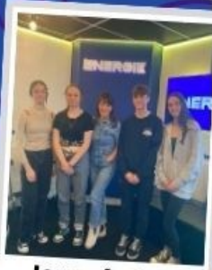
Journée des médias