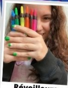
Réveilleurs de Leaders