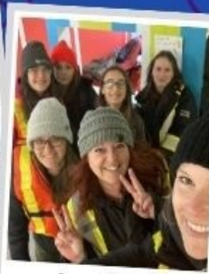
Levées de fonds