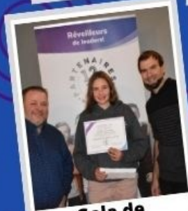
Gala de reconnaissance